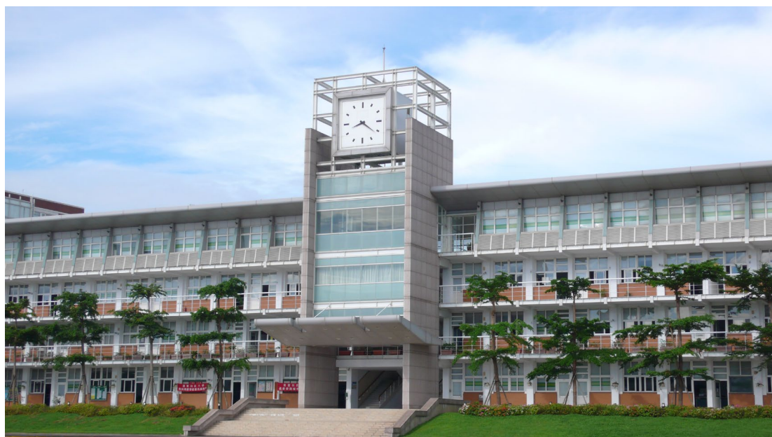
圖 3-5 嶺東科技大學春安校區